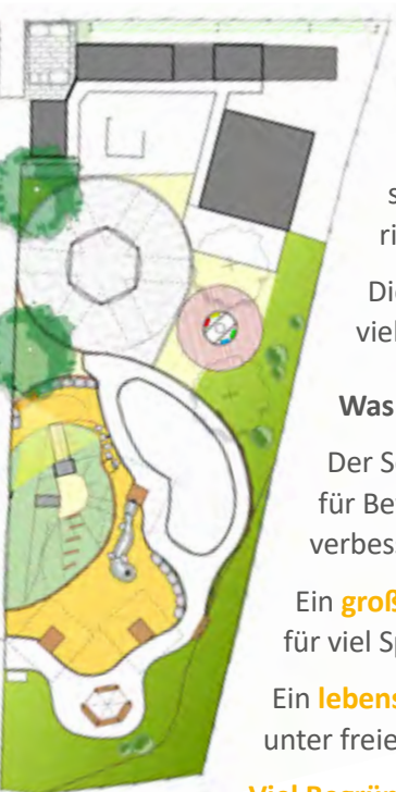
Abb. 1 zeigt den Lageplan unserer Landschaftsarchitektur zum Außen- bereich des 7-Tage-Wohnheims

Was wir schon geschafft haben: Schon bald können wir mit den ersten Arbeiten, zur Modernisierung und Erneuerung des Außenbereichs unseres 7-Tage-Wohnheims, beginnen.